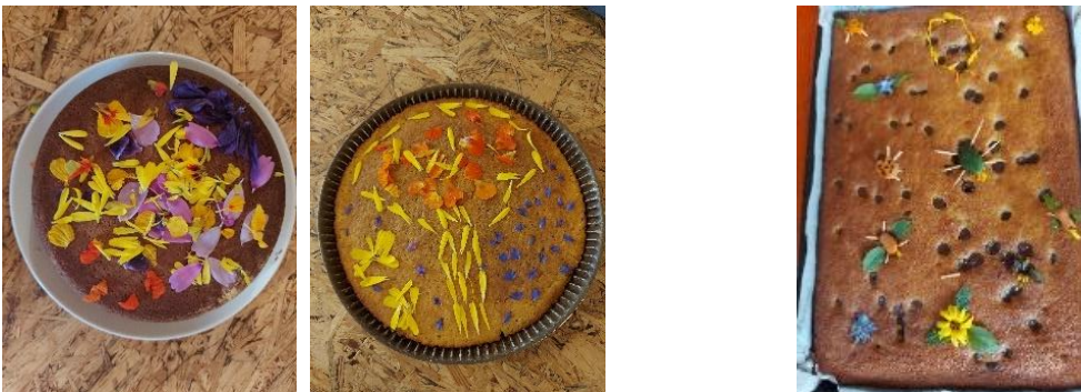
Décoration du gâteau sur la thématique des insectes