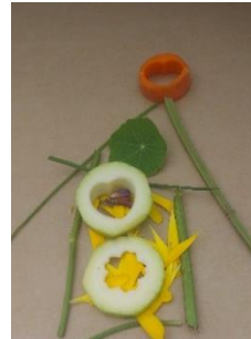
Hôtel à insectes