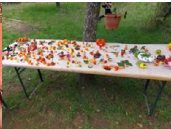
Tout se mange.... Créer des "toiles mangeables"